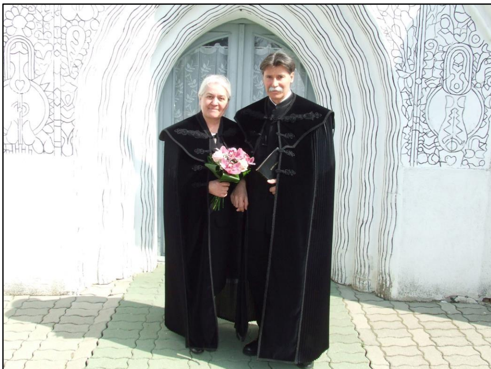
A Gyülekezet búcsúzó lelkipásztorai

Isten áldását kérjük további életükre és nyugdíjas éveikre. Kívánjuk, hogy maradjanak meg az Úr Jézus hűséges szolgálóinak.